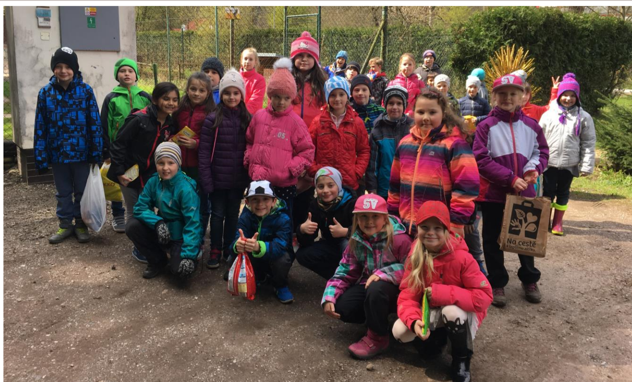
Foto – družinové děti v útulku pro zvířátka