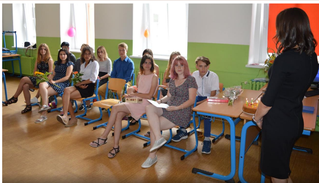
Foto – slavnostní předávání vysvědčení žákům 9. ročníku