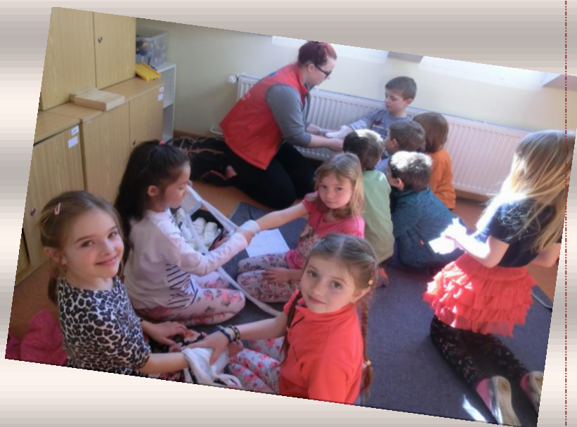
Foto – výuka 1. pomoci na I. stupni