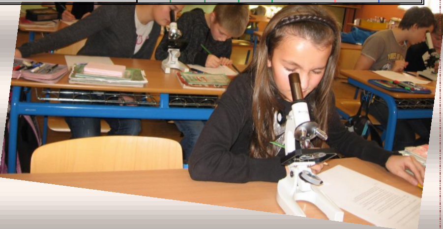
Foto – LP z přírodopisu - II. stupeň